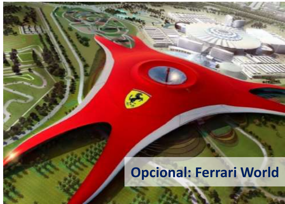
Opcional: Ferrari World