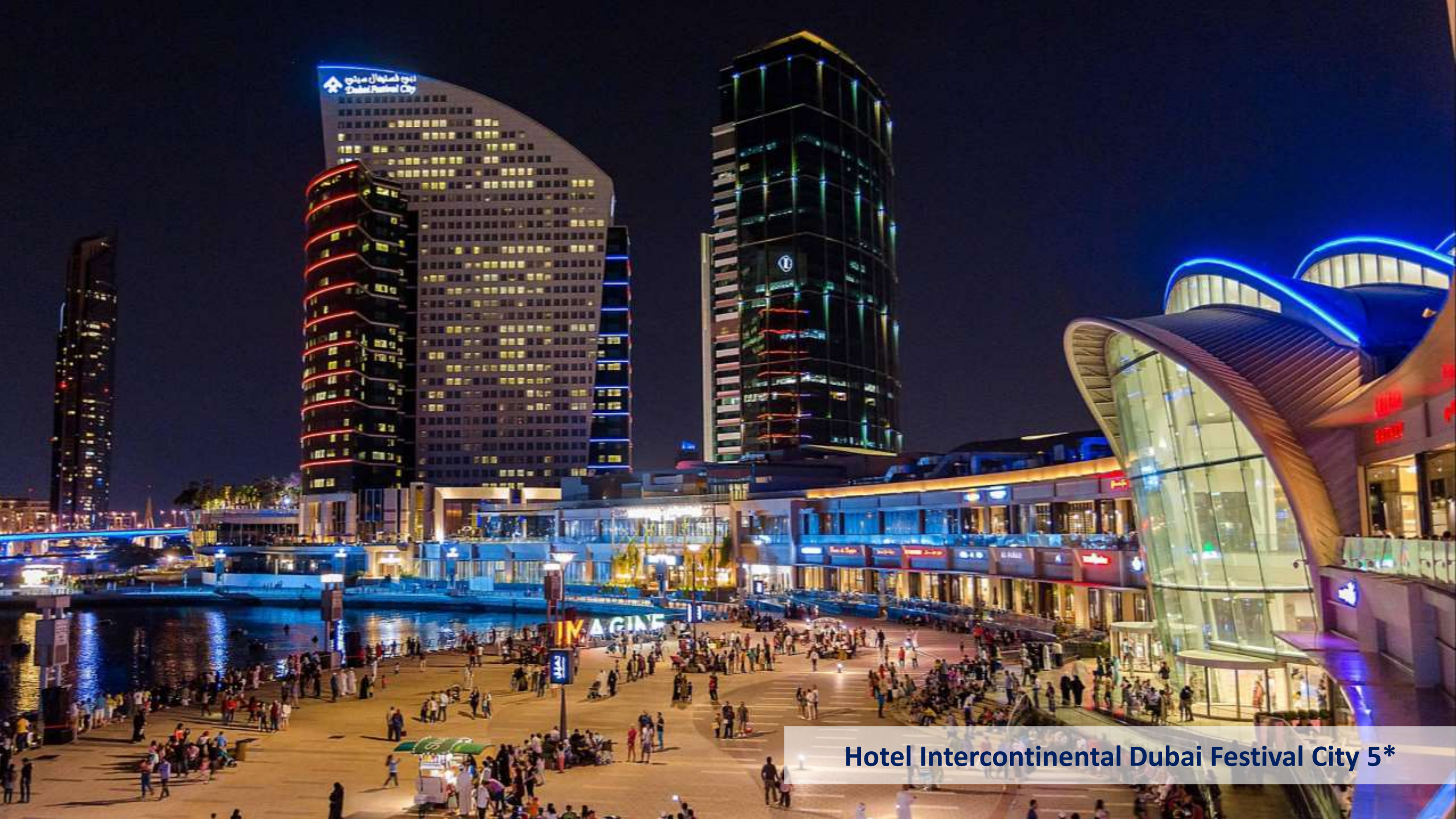
Hotel Intercontinental Dubai Festival City 5*