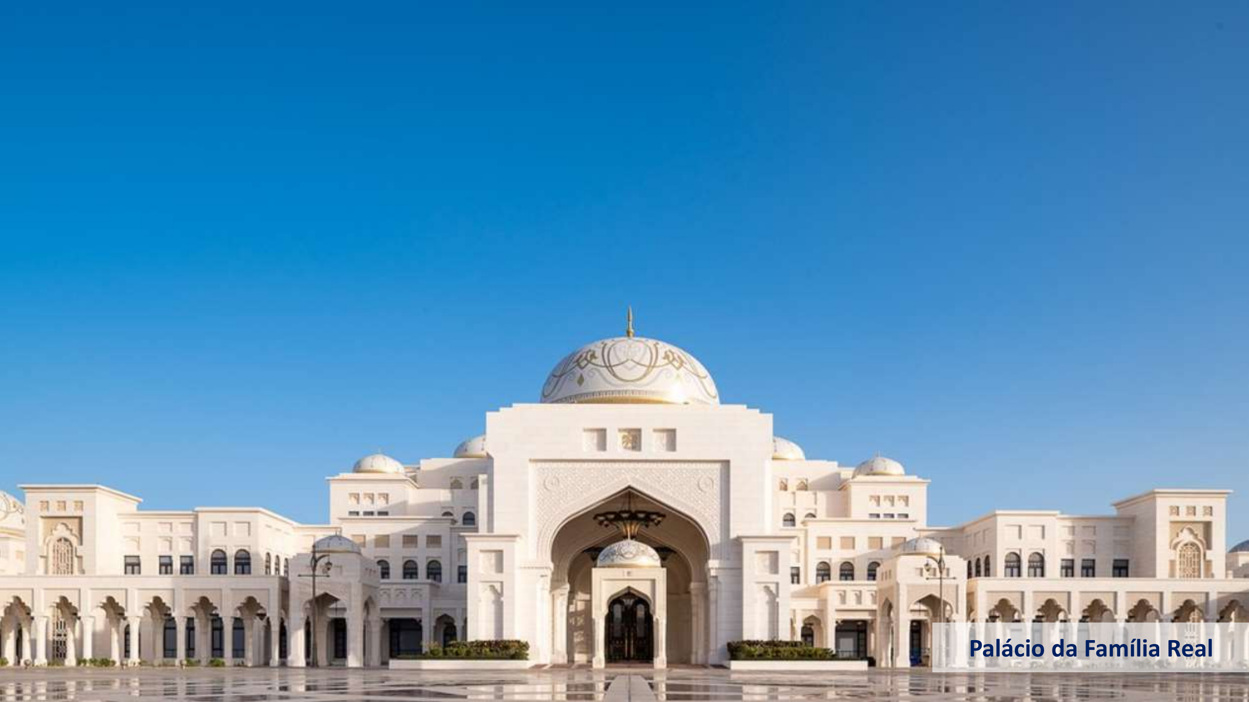
Palácio da Família Real