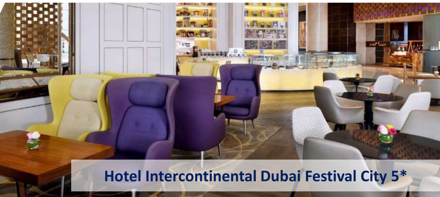
Hotel Intercontinental Dubai Festival City 5*