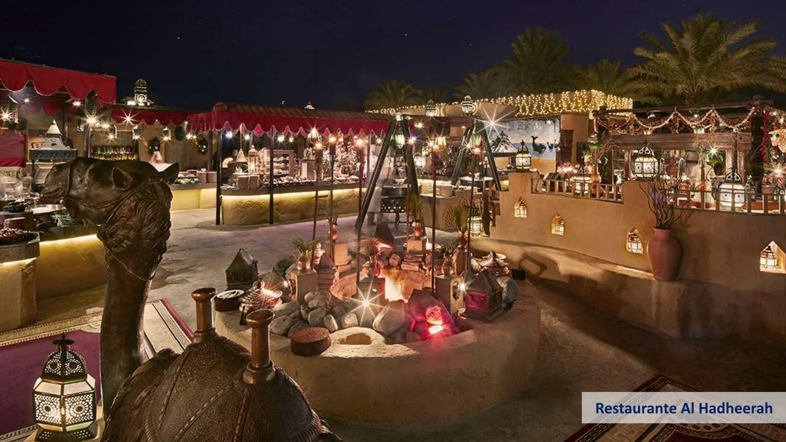
Restaurante Al Hadheerah