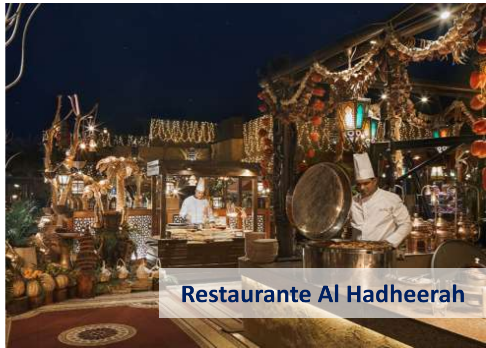
Restaurante Al Hadheerah