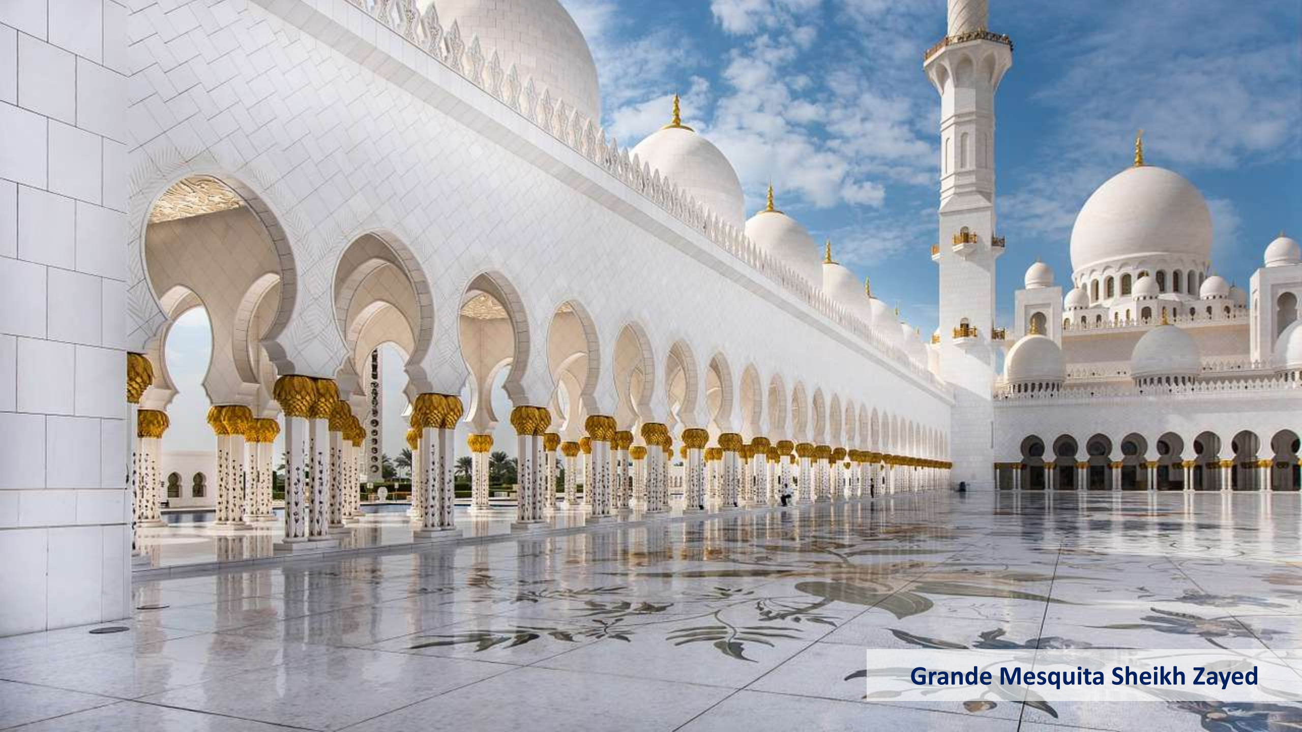
Grande Mesquita Sheikh Zayed