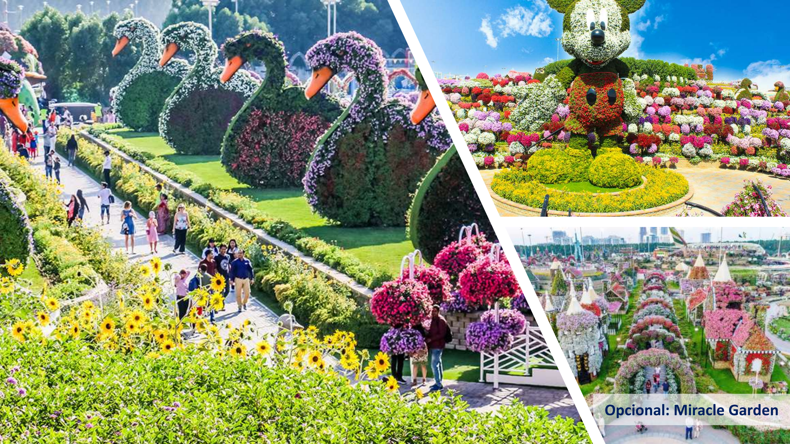
Opcional: Miracle Garden