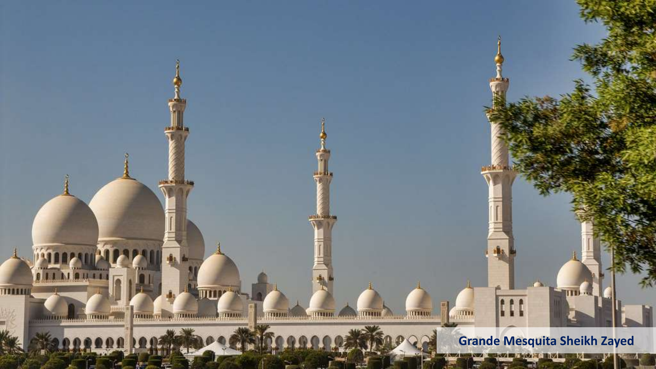
Grande Mesquita Sheikh Zayed