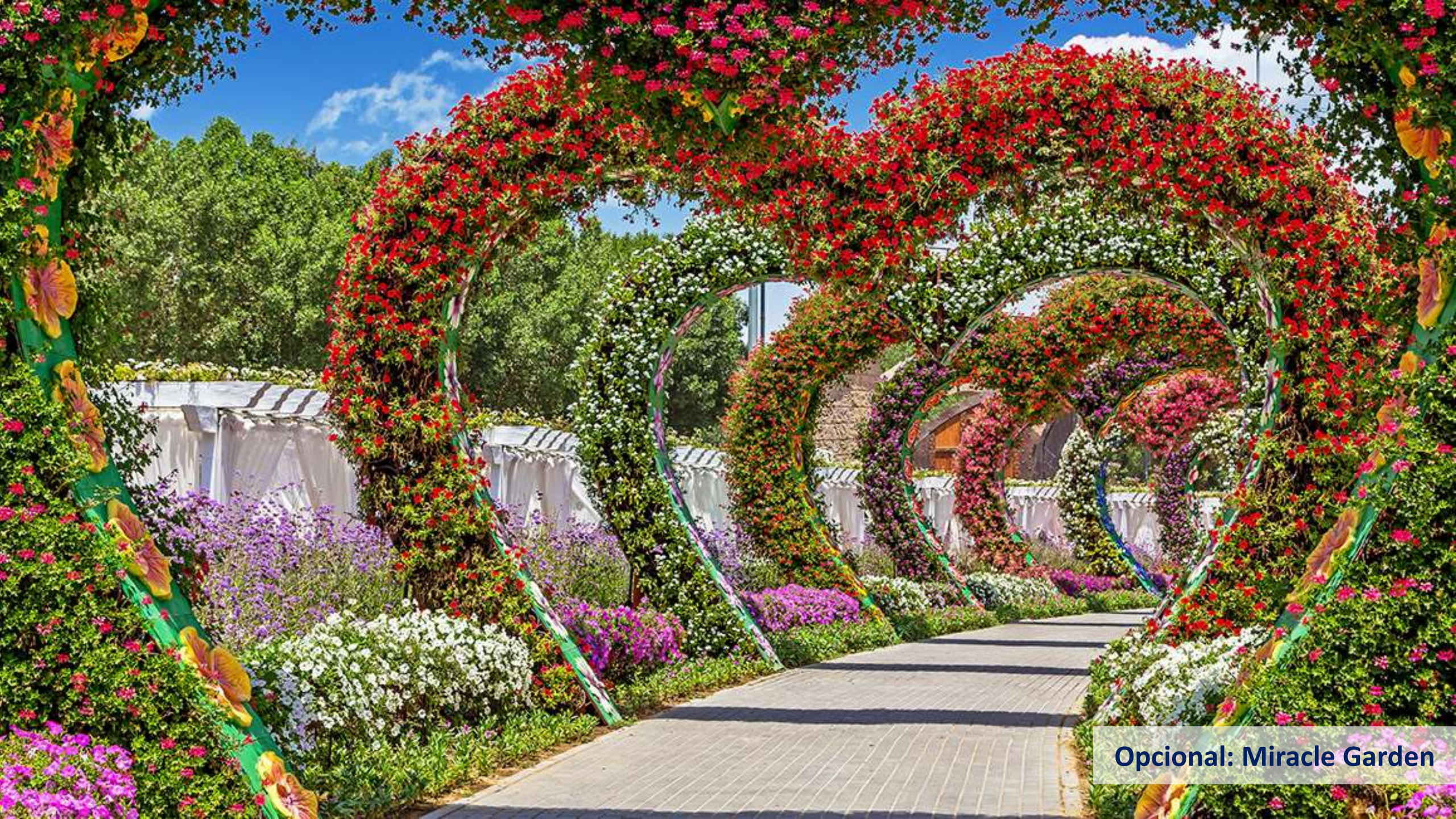
Opcional: Miracle Garden