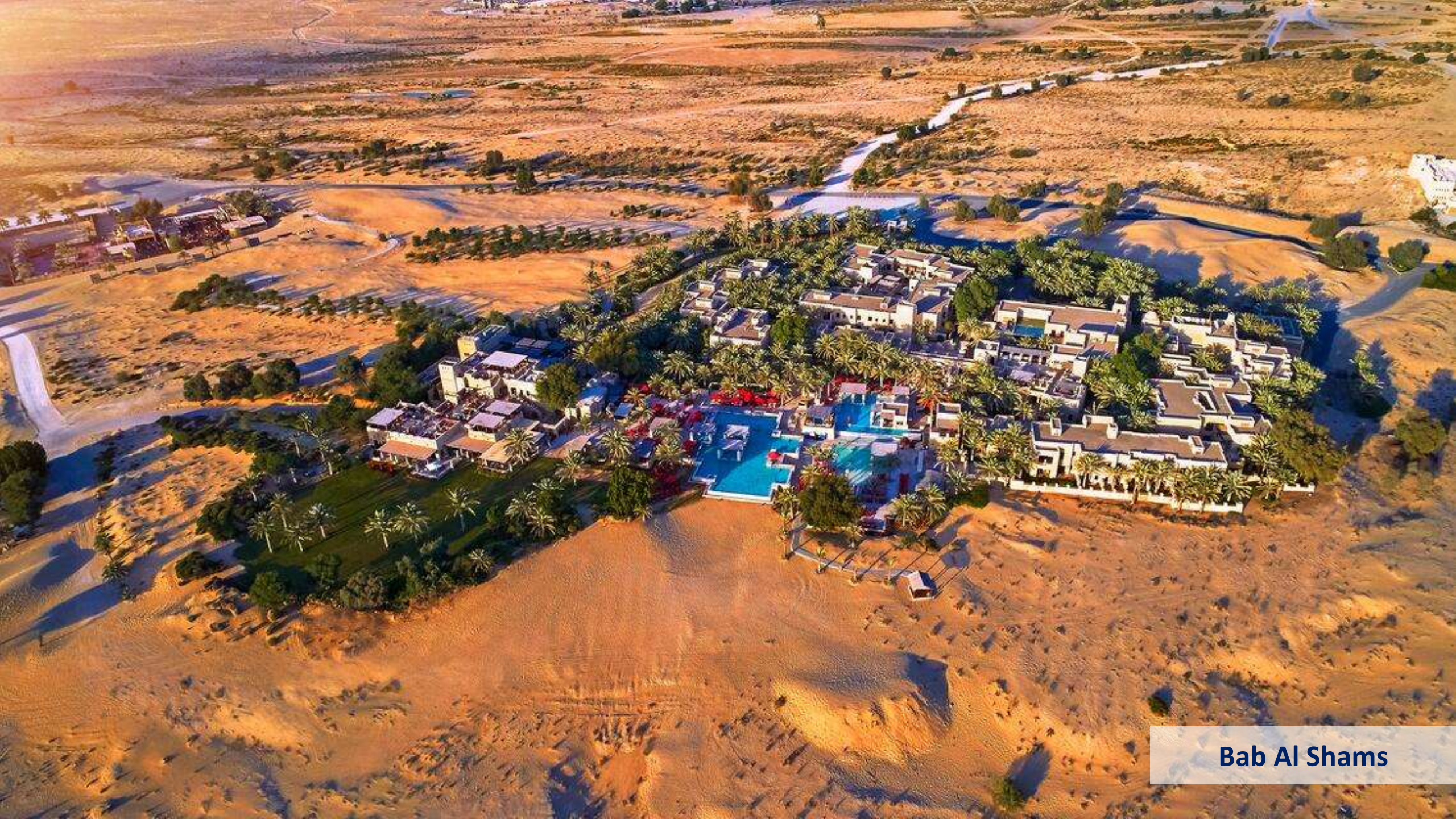
Bab Al Shams