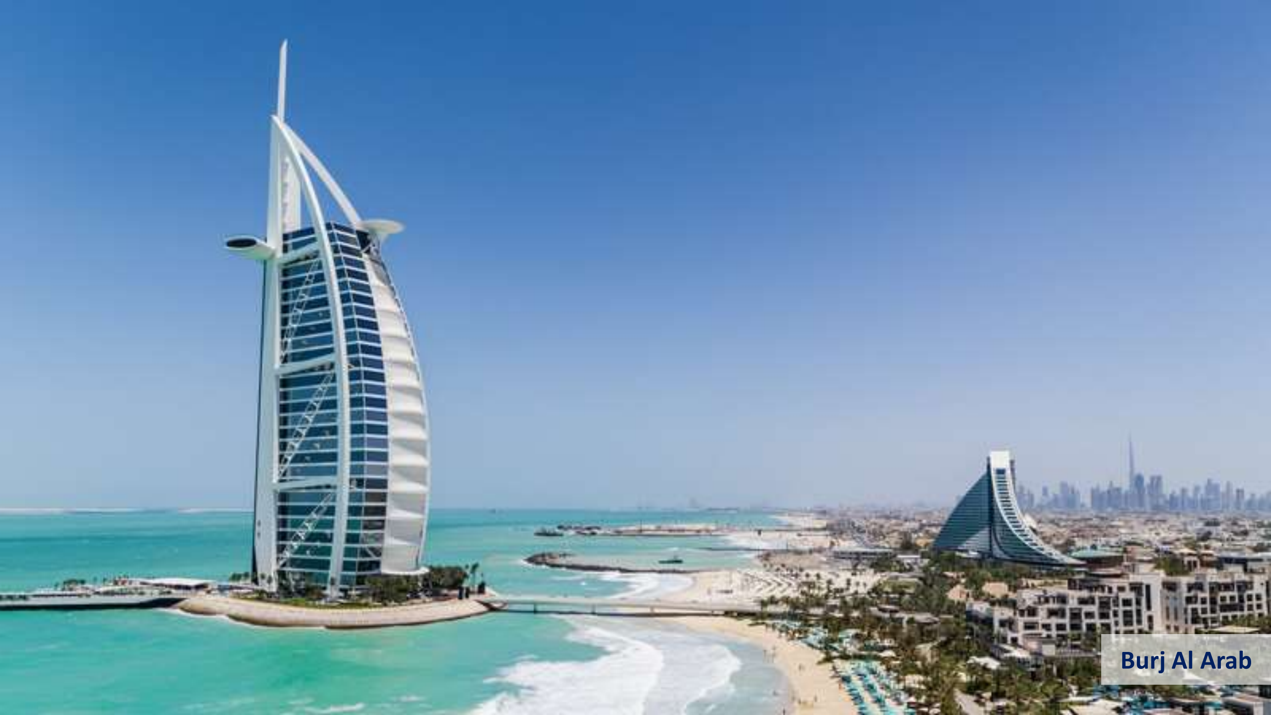
Burj Al Arab