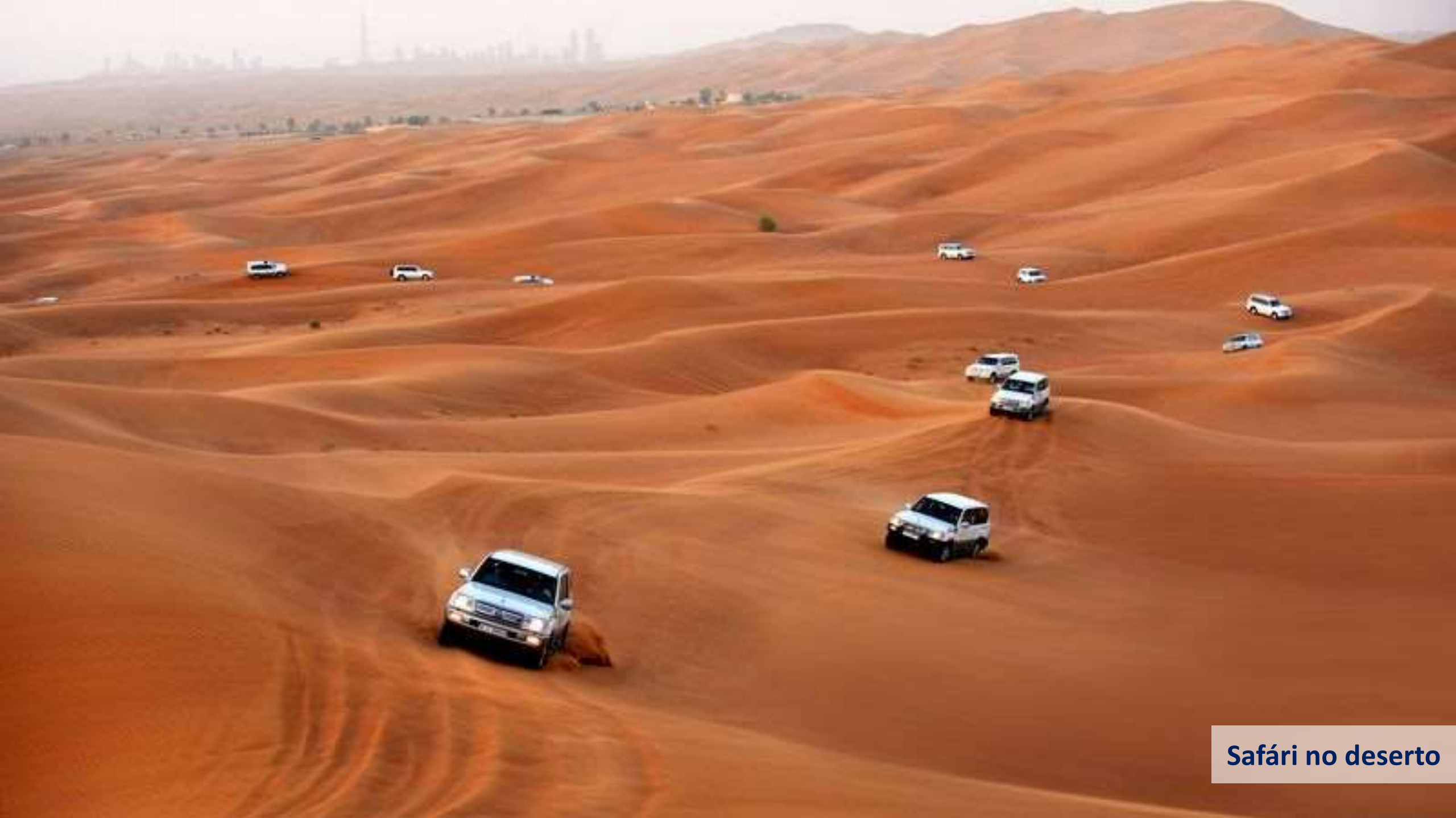
Safári no deserto