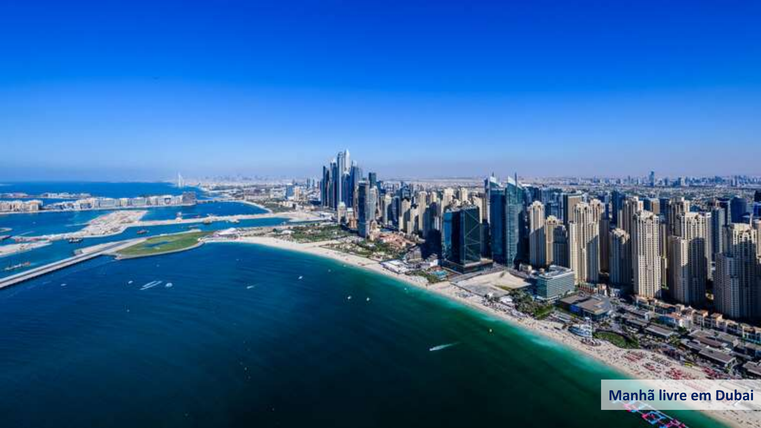
Manhã livre em Dubai